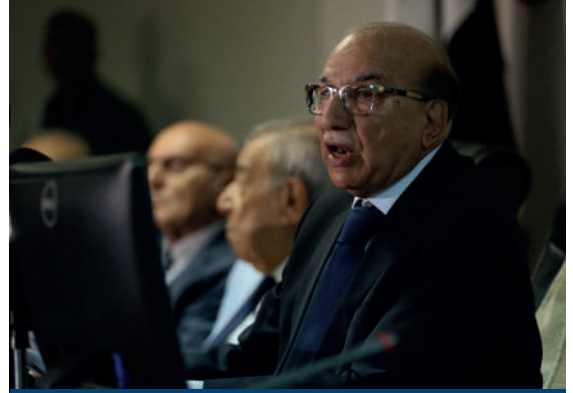
Irak Federal Yüksek Mahkeme Başkanı Mithat Mahmut 2018 parlamento seçimlerinde kullanılan oyların yeniden sayılmasıyla ilgili kararı açıklıyor.

ABD işgaliyle Baas rejiminin devrilmesi, kamu mallarının yağmalanması ve ateşe verilmesine yol açmıştır. Mahkemeler; yıkım ve yağmalama eylemlerine maruz kalmıştır. Böylece Irak yargısının prestiji büyük bir darbe almıştır. Birçok yargıç ateşe verilen mahkeme binalarında yargı prestijinin olmayacağını belirtmiştir. Yargı kurumlarının adaleti yerine getirmesinde binaların yapısı ve görkemi devletin saygınlığı dolayısıyla hukukun üstünlüğü açısından önemlidir. Böylece Baas rejimi döneminden sınırlı olarak kalan yargı saygınlığı; işgalin ortaya çıkardığı kargaşayla neredeyse sonlandırılmıştır.