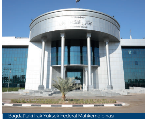
Bağdat'taki Irak Yüksek Federal Mahkeme binası