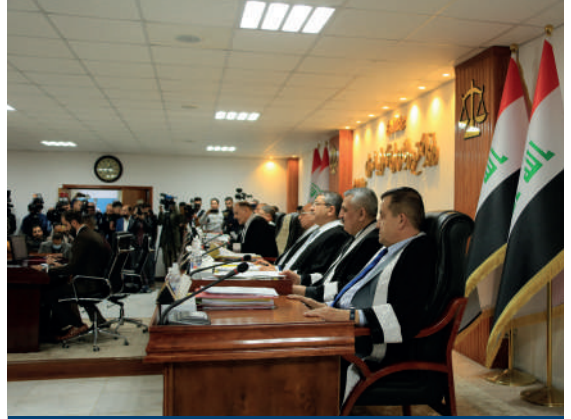
Irak Yüksek Federal Mahkemesi, genel seçim sonuçlarının iptali için yapılan başvurunun reddine hükmetti.

Irak yargı sistemi 2003 yılından sonra kuvvetler ayrılığı ve yargı bağımsızlığı üzerine inşa edilmiştir. Bu husus, yargı erkinin örgütlenmesi şeklinden de anlaşılmaktadır. Ancak Irak'taki yargı sistemi gerek 2003 yılı öncesindeki diktatör rejimi gerekse 2003 yılından sonra ortaya çıkan din, mezhep ve etnik temelli yetki paylaşımı üzerine kurulan siyasal sistem, yargının yapısı ve işlevini etkilemiştir. 2003 yılı öncesi ve sonrası Irak'taki yargı kurumlarının, yürütme ve yasama güçlerinin etkisi altında kaldığı görülmektedir. Halk iradesine dayanan parlamento ve hükümetlerin eylemlerinin hukuka uygunluğunu denetlemek için bağımsız yargı kurumlarının bulunmasını gerekir.