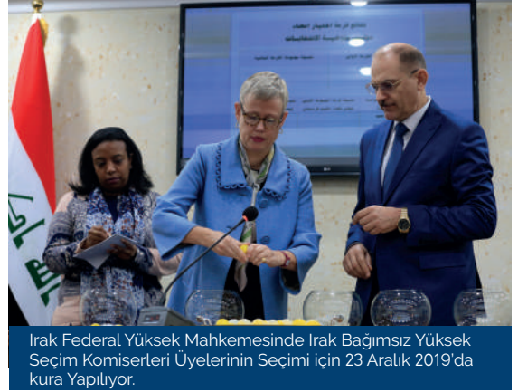
Irak Federal Yüksek Mahkemesinde Irak Bağımsız Yüksek Seçim Komiserleri Üyelerinin Seçimi için 23 Aralık 2019'da kura Yapılıyor.