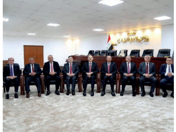
Irak Federal Yüksek Mahkeme Üyeleri

Irak'ın yargı sistemi, genellikle siyasi gelişmelerin akabinde önemli gelişmeler yaşamıştır. Tarihsel olarak Osmanlı dönemi, İngiliz işgali ve ulusal kodlar dönemi olarak üçe ayrılmaktadır. Bu çalışmanın konusu bakımından Baas rejimi dönemi ve sonrası Irak'ın yargı sisteminin açıklığa kavuşturulması önem arz etmektedir. Irak yargı kurumlarının bağımsızlığı, Baas rejiminin diktatör yönetiminden payını almıştır. Bu nedenle tarihsel olarak Baas rejiminin yargıda yaptığı değişiklikler, Irak'ın gelecek süreçteki yargı işlemleri ve siyasi sürecine etkisi büyük olmuştur.